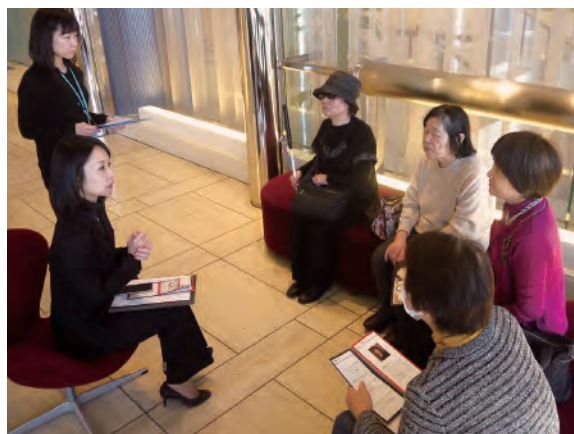
視覚障害者のための公演説明会「ランチタイム・パイプオルガンコンサート Vol.115」

最近では、これらの鑑賞サポートを利用されたお客様同士が、スタッフを交えて、公演の感想や意見を交わす場所作りも試行し始めました。2015年8月の『気づかいルーシー』終演後の意見交換会では、松尾スズキ原作による