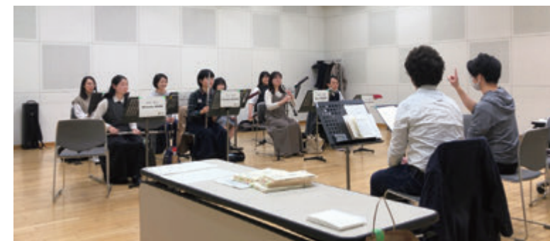
レッスンの様子（木管セクション オーケストラ・スタディ）