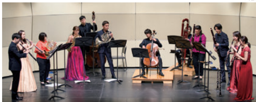
第8回演奏会：室内楽演奏会より アカデミー生と講師による演奏（2022年2月10日）