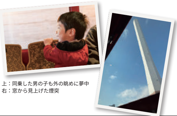
上：同乗した男の子も外の眺めに夢中 右：窓から見上げた煙突

なレストランや隠れ家のようなカフェ、ひっそりとした佇まいの書店などが連なっている。一つひとつこだわりと個性が感じられる。