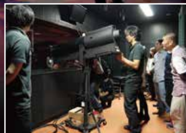
客席後ろの<投映室>で、ピンスポットの操作について説明を受ける参加者。

音響、照明オペレーション室の大きな調整卓にも驚きの声。機材に触って見ます。照明機材のピンスポット操作って難しい！ スタッフと直接言葉を交わすのも新鮮です。裏方さんって、とても親切なんですね。