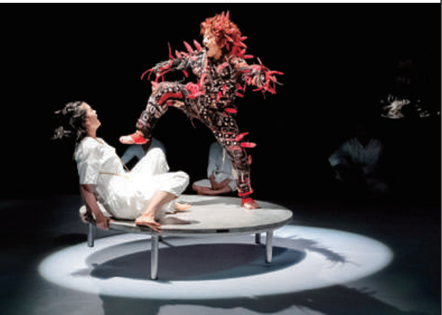
東京演劇道場 第一回公演「赤鬼」

というのも、道場は何かしらの強固なカリキュラムに則って展開されているわけではなく、ワークショップを通じて「舞台における正解とは何か」が示されるわけでもない。また参加する道場メンバーらの出自はさまざまで、例えば身体のワークショッ