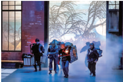
太陽劇団（テアトル・デュ・ソレイユ） 『金夢島 L'ÎLE D'OR Kanemu-Jima』