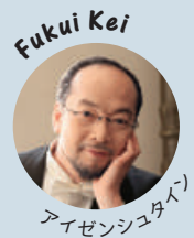
アイゼンシュタイン