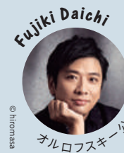
オルロフスキー公爵