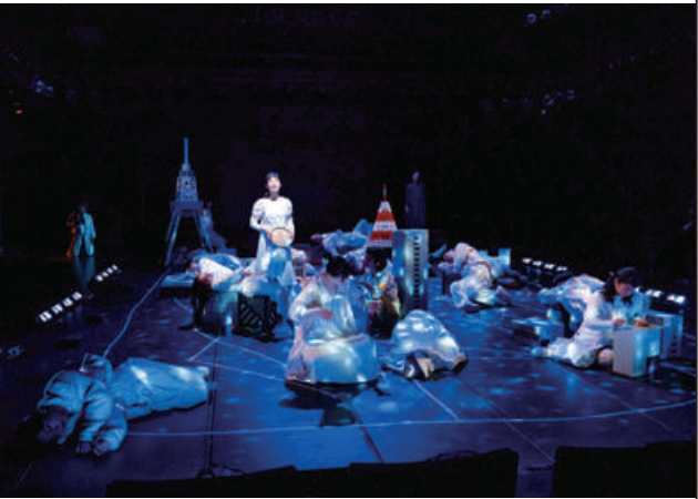
東京演劇道場 第二回公演「わが町」