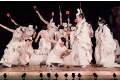
SPAC-静岡県舞台芸術センター 『マハーバーラタ～ナラ王の冒険～』

9月1日金～10月29日日 東京芸術劇場、ロサ会館、 メトロポリタンプラザビル自由通路、 東京都豊島区池袋周辺エリアほか 詳細はP08、P13へ