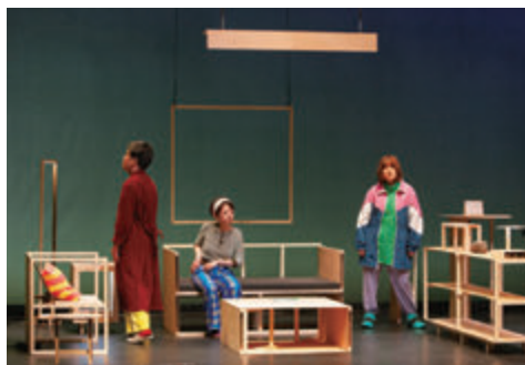
世界初演（Wiener Festwochen 2023）より